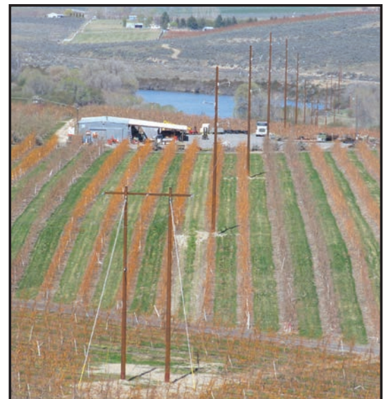
Arriba: La línea de transmisión Okanogan-Brewster ha sido reconstruida con postes de acero.