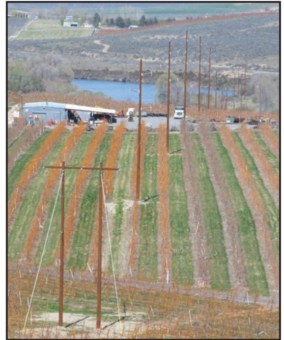
Above: The Okanogan-Brewster transmission line has been rebuilt with steel poles.